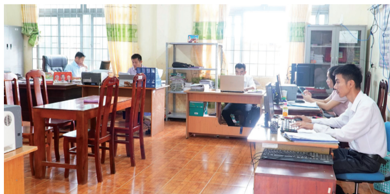
Dù làm việc trong phòng ốc chật hẹp, nhưng cán bộ xã Quảng Sơn luôn trách nhiệm cao với công việc chuyên môn.

Cấp ủy, chính quyền xã Quảng Sơn nỗ lực khắc phục mọi khó khăn về cơ sở vật chất trong giai đoạn đầu chuyển tiếp bảo đảm bộ máy vận hành thông suốt.