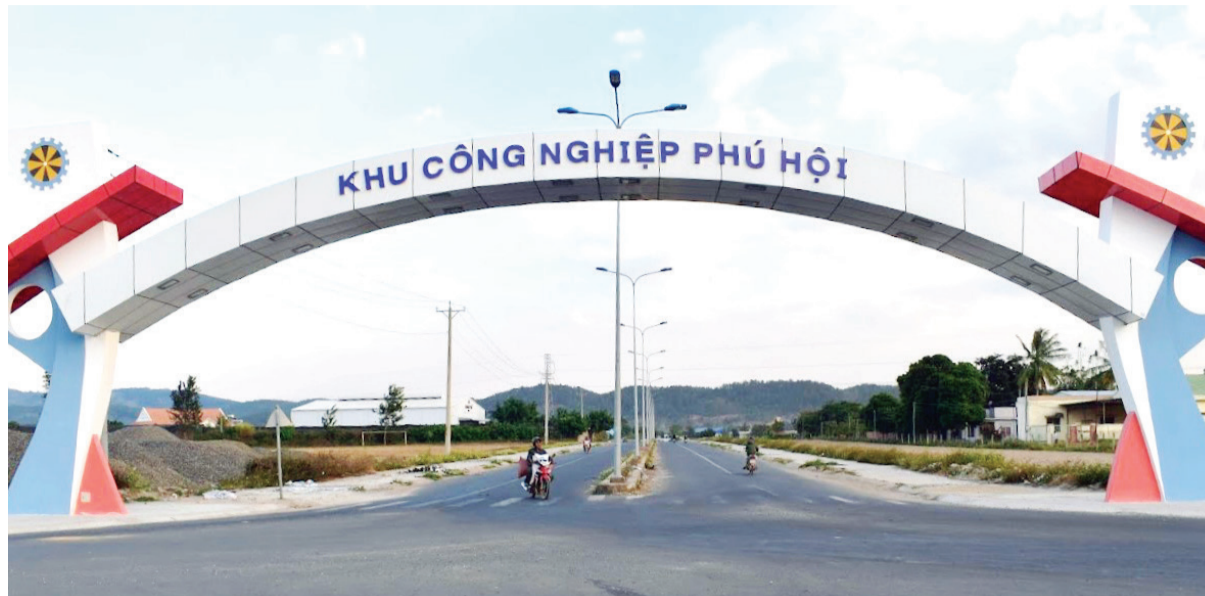
Xây dựng hoàn thiện cơ sở hạ tầng là một trong những giải pháp tạo điều kiện thuận lợi cho các doanh nghiệp đẩy nhanh tiến độ dự án đầu tư tại KCN Phú Hội.

Lũy kế đến nay, 2 Khu công nghiệp (KCN) Lộc Sơn và Phú Hội của tỉnh Lâm Đồng có 87 dự án (20 dự án FDI) còn hiệu lực với tổng vốn đăng ký đầu tư hơn 5.504,5 tỷ đồng và 125,7 triệu USD, tổng diện tích đất đăng ký hơn 168,7 ha, lao động 14.300 người. Trong đó, tại KCN Lộc Sơn có 36 dự án (9 dự án FDI) và KCN Phú Hội có 25 dự án (9 dự án FDI), hoạt động sản xuất, chế biến, kinh doanh các sản phẩm đặc trưng như trà; cà phê; rau, củ, quả tươi, đông lạnh, sấy khô; dẹt lựu tơ tằm; các sản phẩm may mặc, dẹt len; vật liệu xây dựng; hàng trang trí nội thất, gỗ ghép; chế biến khoáng sản (đá granite, basalt, cao lanh, diatomite); bia, rượu xuất khẩu; nấm mỡ chất lượng cao. Dự kiến kết quả hoạt động sản xuất, kinh doanh của các doanh nghiệp 2 KCN Lộc Sơn và Phú Hội trong năm 2025 đạt tổng giá trị xuất khẩu gần 169 triệu USD, giá trị nội tiêu hơn 6.662 tỷ đồng, nộp