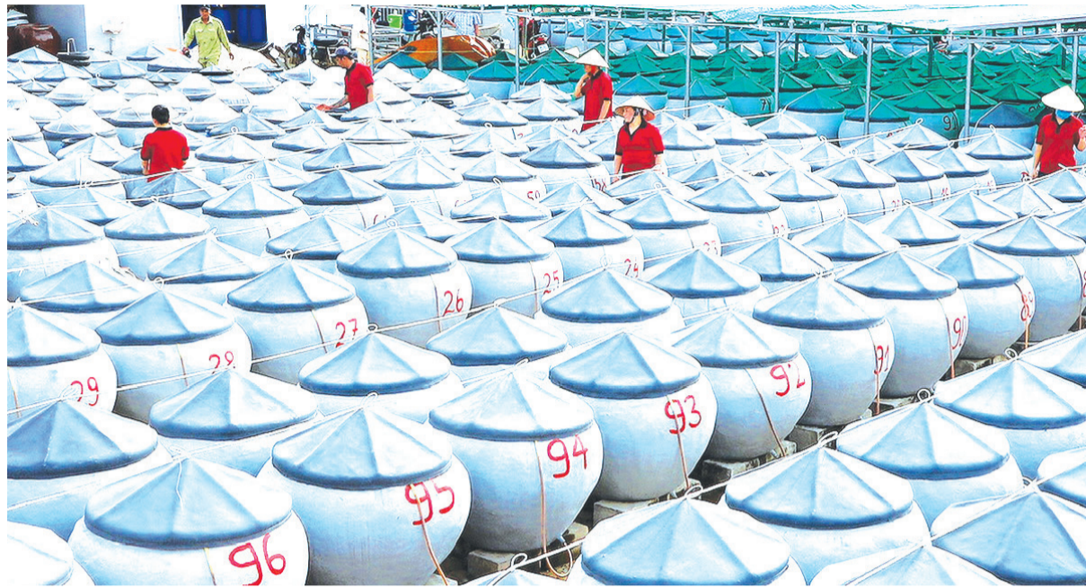
Sản xuất nước mắm truyền thống.