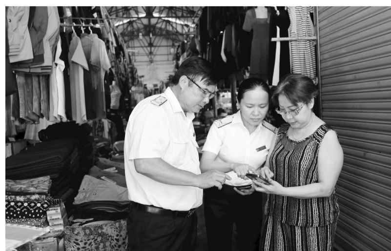
Các tiểu thương tại xã Cư Jút (Lâm Đồng) được cán bộ Thuế Cơ sở 14 (Thuế tỉnh Lâm Đồng) hướng dẫn cập nhật chính sách thuế kịp thời.

Dù hộ kinh doanh chỉ nhận tiền mặt, sử dụng nhiều tài khoản khác nhau hay thay đổi phương thức