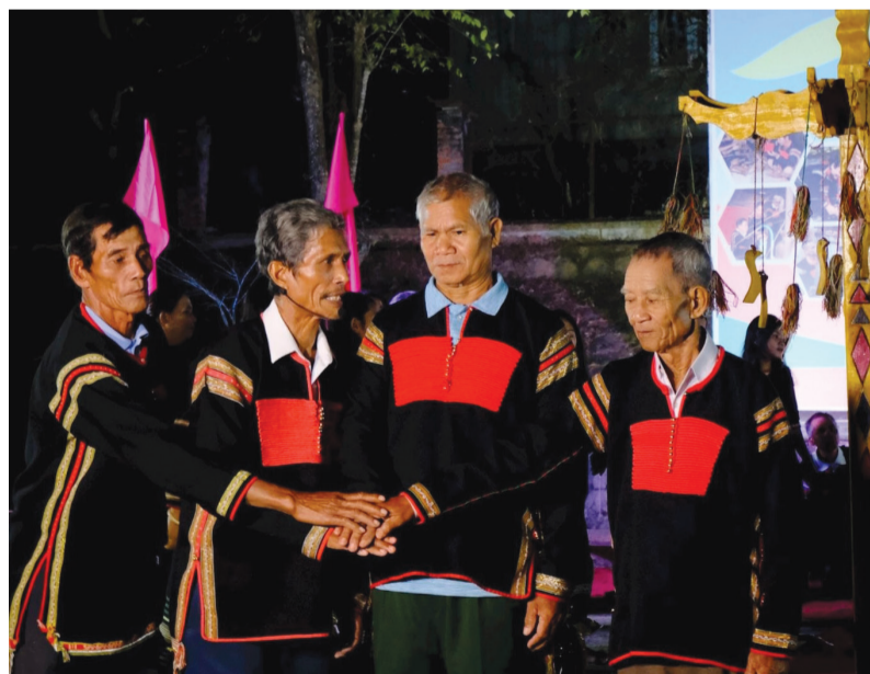
Nhịp sống hiện đại nhưng người Ê đê vẫn giữ được nhiều phong tục truyền thống quý báu.

Có dịp được chứng kiến Lễ kết nghĩa của người Ê đê ở xã Cư Jút, chúng tôi hiểu hơn ý nghĩa nhân văn, giá trị văn hóa đặc sắc, thể hiện tinh thần đoàn kết trong cuộc sống, sinh hoạt trong đồng bào dân tộc nơi đây. Theo đó, ngày diễn ra lễ, khi mặt trời vừa lên khỏi rặng núi phía đông, cả buôn làng Ê đê ở xã Cư Jút rộn ràng tiếng trống, chiêng, báo hiệu một sự kiện thiêng liêng Lễ kết nghĩa anh em. Giữa không gian nhà dài truyền thống, những người đàn ông Ê đê mặc khố, quàng khăn đỏ, ngồi ngay ngắn bên ché rượu cần, chờ đợi giờ phút thiêng liêng nhất