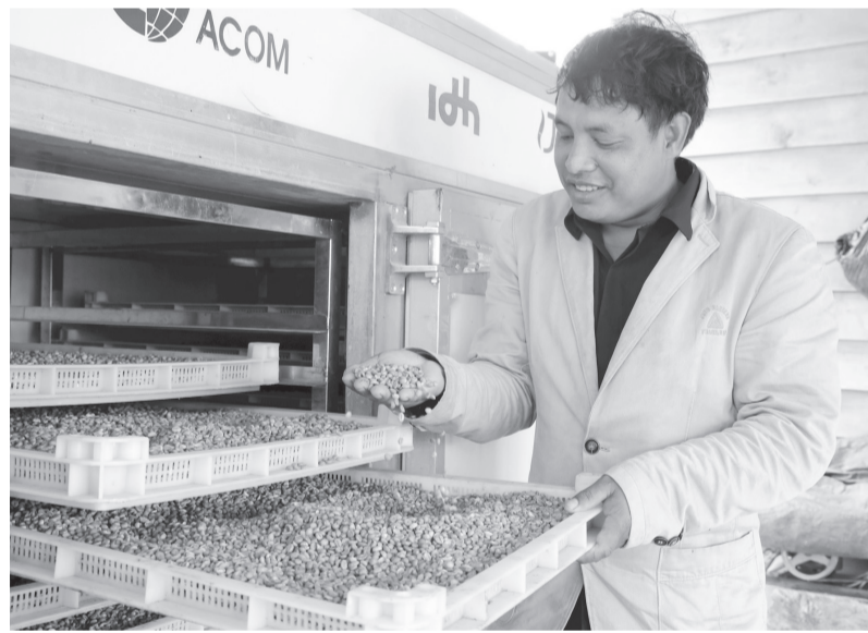
Từng hạt cà phê được lựa chọn và sơ chế cẩn thận.

Trong số gần 4.000 ha cà phê của toàn huyện Lạc Dương cũ, xã Đưng K'nó có tổng diện tích khoảng trên 900 ha với sản lượng trung bình đạt trên 400 tấn nhân xanh. Người dân chủ yếu sống bằng nghề trồng cà phê từ năm 1996 đến nay với lối canh tác truyền thống, chủ yếu chăm bón bằng phân chuồng, hạn chế