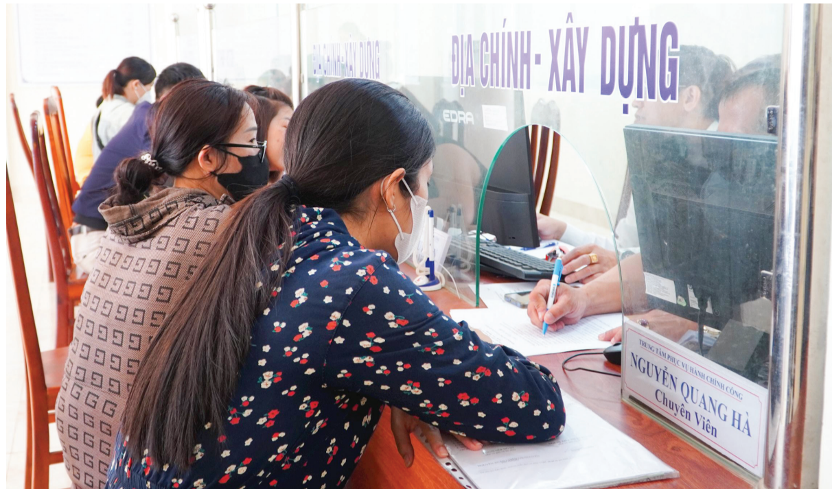
Trung tâm phục vụ hành chính công phường Bắc Gia Nghĩa nêu cao tinh thần, trách nhiệm trong giải quyết thủ tục hành chính cho người dân, tổ chức.