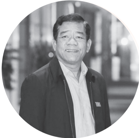
Đại biểu Quốc hội K'Nhiều.

Là đại biểu Quốc hội khóa XV, Ủy viên Hội đồng Dân tộc của Quốc hội, ông K'Nhiều đã và đang khẳng định vai trò là người đại diện xứng đáng cho tiếng nói của đồng bào dân tộc thiểu số. Xuất thân từ buôn làng Tây Nguyên, đại biểu K'Nhiều luôn thể hiện tinh thần trách nhiệm cao, gắn gũi với Nhân dân và quyết liệt trong hoạt động nghị trường.