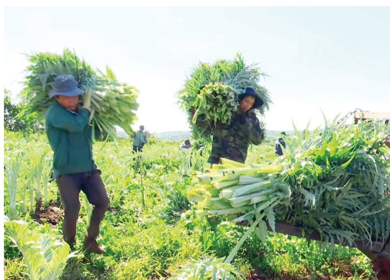
Atiso được người dân xã Tân Hà Lâm Hà trồng và có đầu ra ổn định.

Sau một thời gian trồng thử nghiệm, nhận thấy cây phù hợp với điều kiện tự nhiên nơi đây, đồng thời cho nguồn thu nhập ổn định từ loại cây này nên anh đã bén duyên với loại cây atiso trên