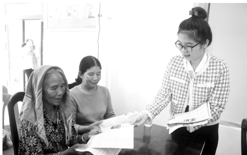
Phổ biến, giáo dục pháp luật bằng cách tổ chức hội nghị tuyên truyền pháp luật và phát tờ rơi cho người dân.

Tuyên truyền phổ biến, giáo dục pháp luật (PBGDPL) là nhiệm vụ đầu tiên của quá trình tổ chức thi hành pháp luật, là cầu nối để truyền tải các chủ trương, chính sách của Đảng, pháp luật của Nhà nước đến với người dân. Chính vì vậy, thời gian qua, các cơ quan, đơn vị, chính quyền địa phương đã tăng cường tuyên truyền đến với người dân bằng nhiều hình thức. Cụ thể, tổ chức Hội nghị tuyên truyền, PBGDPL; lồng ghép trong các hội nghị của cơ quan, đơn vị, địa phương; các buổi sinh hoạt, cuộc họp của cơ quan, đơn vị; thông qua các phương tiện thông tin đại chúng, loa truyền thanh ở cơ sở; phát hành tờ rơi, tờ gấp pháp luật, đĩa CD, để cương, tài liệu hỏi - đáp pháp luật, hưởng ứng Ngày Pháp