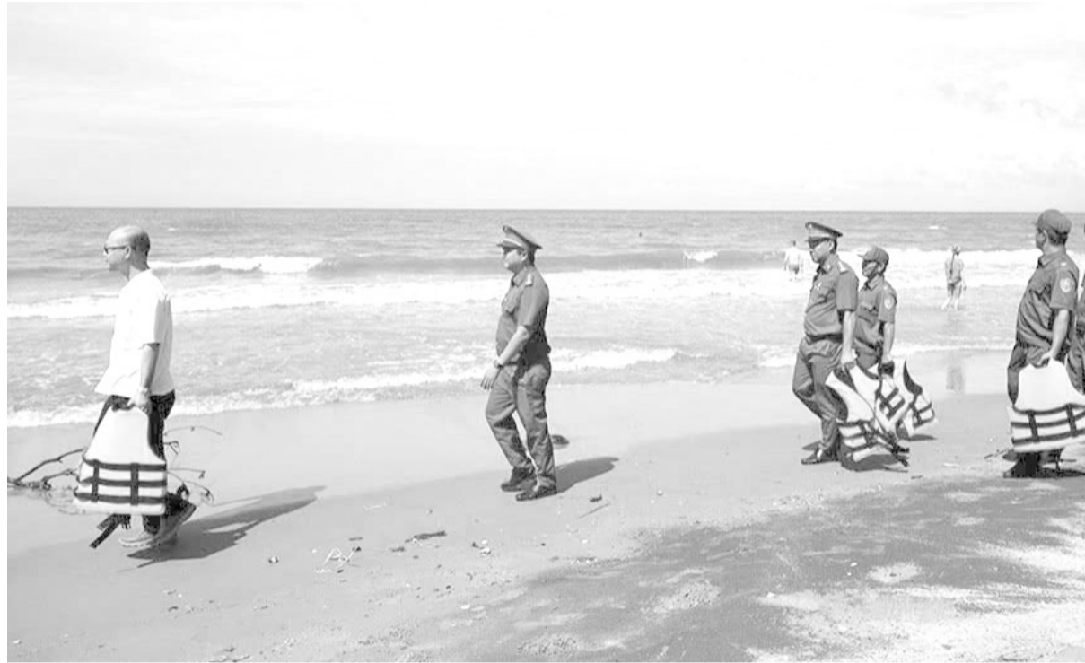
Tổ đảm bảo an toàn du lịch tuyến biển thuộc Công an phường Mũi Né tuần tra dọc tuyến bờ biển.

Từ đầu mùa du lịch hè đến nay, công an các địa phương có đường bờ biển đi qua đã phối hợp chặt chẽ với các lực lượng chức năng tổ chức hàng trăm lượt tuần tra, kiểm soát tại các bãi biển, khu nghỉ dưỡng, tuyến đường trọng điểm và địa bàn đông dân cư. Qua đó, kịp thời phát hiện, xử lý nhiều