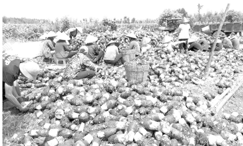
Thu hoạch khoai môn ở xã Trà Tân.

diện tích canh tác làm tăng áp lực nguồn cung trong năm nay.