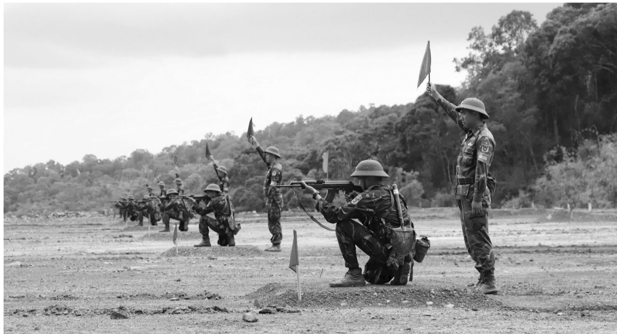
Cán bộ, chiến sĩ Trung đoàn Bộ binh 994A kiểm tra bắn đạt thật cho chiến sĩ mới.

Cán bộ, chiến sĩ phân đội trực chiến nắm chắc nhiệm vụ, sử dụng thành thạo trang bị kỹ thuật, khả năng hiệp đồng chiến đấu đạt khá.