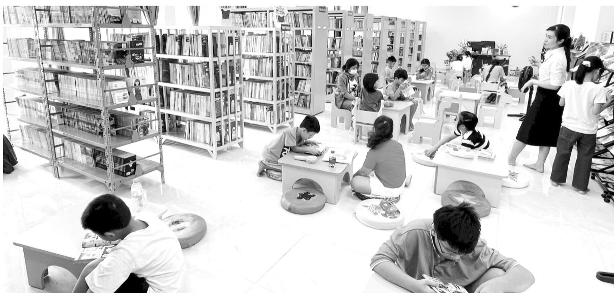
Không gian đọc sách tại thư viện trong mùa hè.