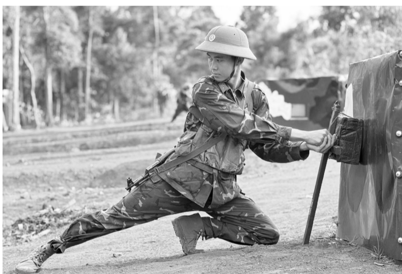
Chiến sĩ, Trung đoàn Bộ binh 994A, Bộ Chỉ huy Quân sự tỉnh thực hành động tác đặt bộc phá.

Để bảo đảm cho huấn luyện, Trung đoàn đã đầu tư hàng trăm triệu đồng và huy động hơn 5.000 ngày công bộ đội để xây dựng, củng cố thao trường. Đồng thời, đơn vị đã làm mới 2.898 mô hình học cụ các loại, đáp ứng yêu cầu huấn luyện năm 2025 theo đúng hướng dẫn. Công tác diễn tập được Trung đoàn 994A triển khai bài bản, sát thực tiễn chiến đấu. Đơn vị tổ chức và tham gia diễn tập các loại như: diễn tập chỉ huy cơ quan trên bản đồ, chuyển trạng thái SSCĐ, diễn tập