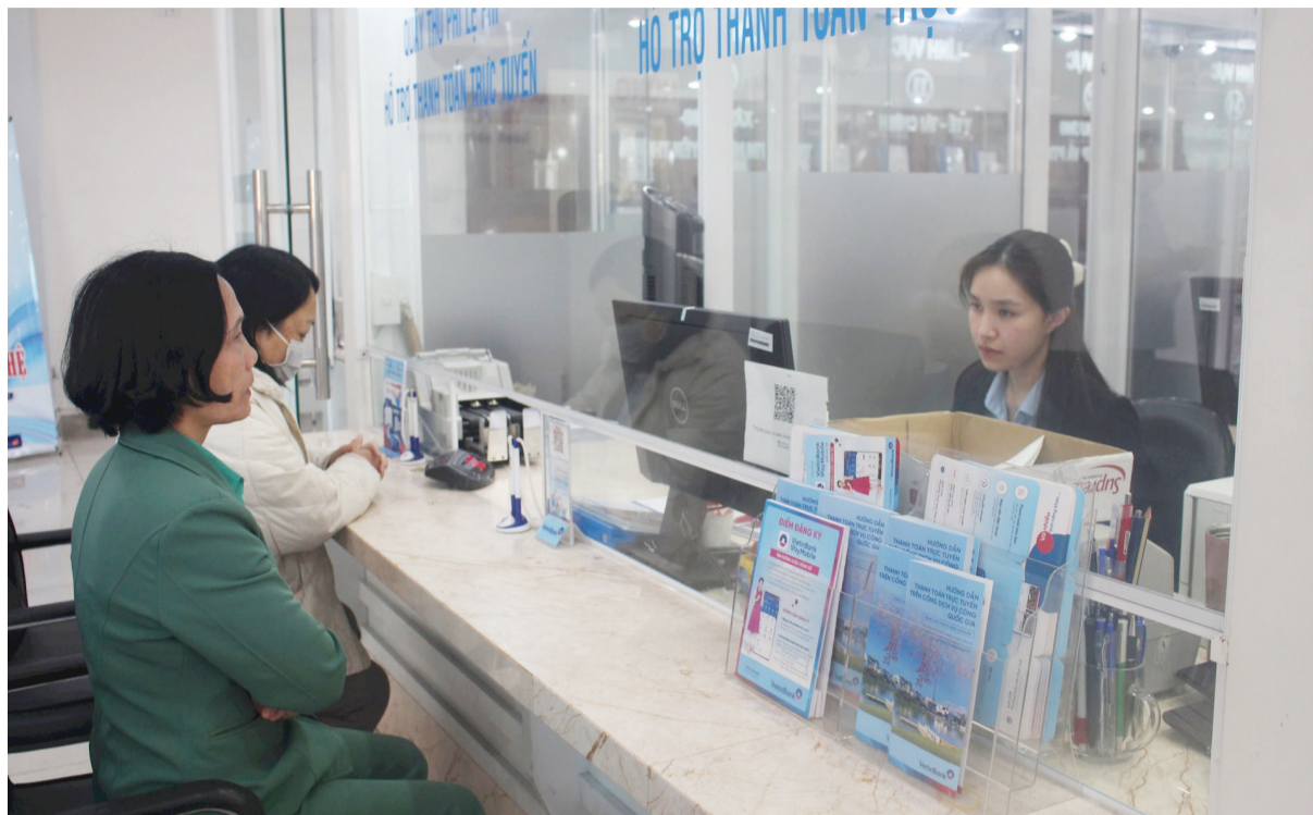
Hỗ trợ thanh toán trực tuyến cho người dân.

Cụ thể, đến nay đã sử dụng hệ thống trực tích hợp chia sẻ dữ liệu (LGSP), trực liên thông văn bản, hệ thống phân giải tên miền (DNS) của tỉnh Lâm Đồng cũ sử dụng cho tỉnh Lâm Đồng mới. Giữ nguyên hiện trạng hoạt động hệ thống hội nghị truyền hình hiện có của các đơn vị hành chính thuộc 3 tỉnh Đắk Nông, Bình Thuận, Lâm Đồng cũ. Nhờ sự phối hợp, hỗ trợ của Cục Bưu điện Trung ương kết nối mạng số liệu chuyên dùng, vận hành hệ thống hợp trực tuyến bằng cách thức định tuyến thông qua thiết bị MCU. Từ ngày 1/7, Lâm Đồng thực hiện thuê dịch vụ đồng bộ lại đường truyền số liệu chuyên