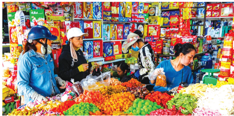
Hộ kinh doanh bán kẹo trong chợ Phan Thiết.

kinh doanh cá thể, tăng 5,6% so với năm 2023. Trong đó đã có giấy chứng nhận đăng ký kinh doanh là 24.888 cơ sở, chưa đăng ký kinh doanh là 42.138 cơ sở, đã đăng ký kinh doanh nhưng chưa được cấp giấy chứng nhận đăng ký kinh doanh 231 cơ sở và không phải đăng ký kinh doanh 3.683 cơ sở. Những nơi có rất nhiều hộ kinh